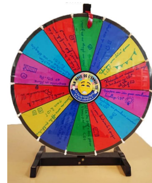
Roue de l'ennui