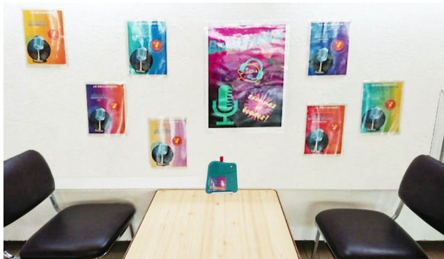
Espace d'écoute de la webradio (affiches enrichies via Bookinou)