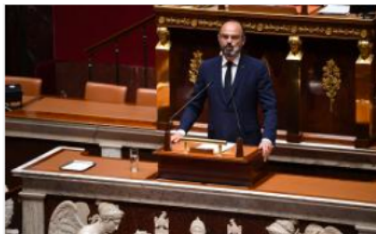
Déconfinement : l'Assemblée approuve le plan du gouvernement par 368 voix contre 100

Le 28 avril 2020, Après la présentation du Premier Ministre, les députés votent pour ou contre le plan de déconfinement