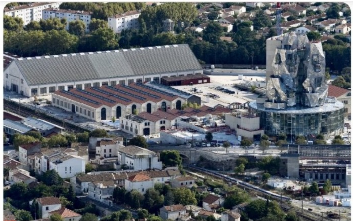
1 La fondation Luma à Arles (Bouches-du-Rhône): du site industriel au site culturel

credit image : Manuel Belin Education, Géographie, 1ère, 2019.