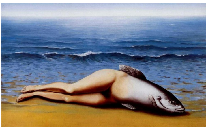
A / René Magritte, L'invention collective , 1935

A laquelle de ces deux œuvres cette citation pourrait-elle servir de légende : A ou B ?