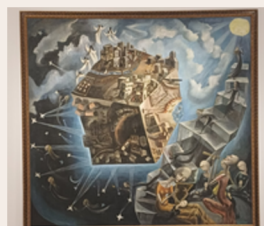
Museo Reina Sofía

Todas las fotos fueron tomadas por nuestro grupo durante el viaje escolar a Madrid.