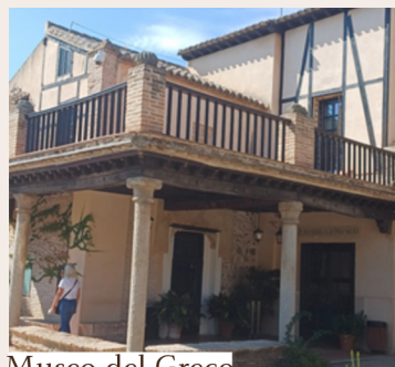
Museo del Greco