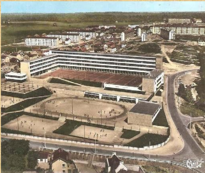
IL LICEO NEL 1967