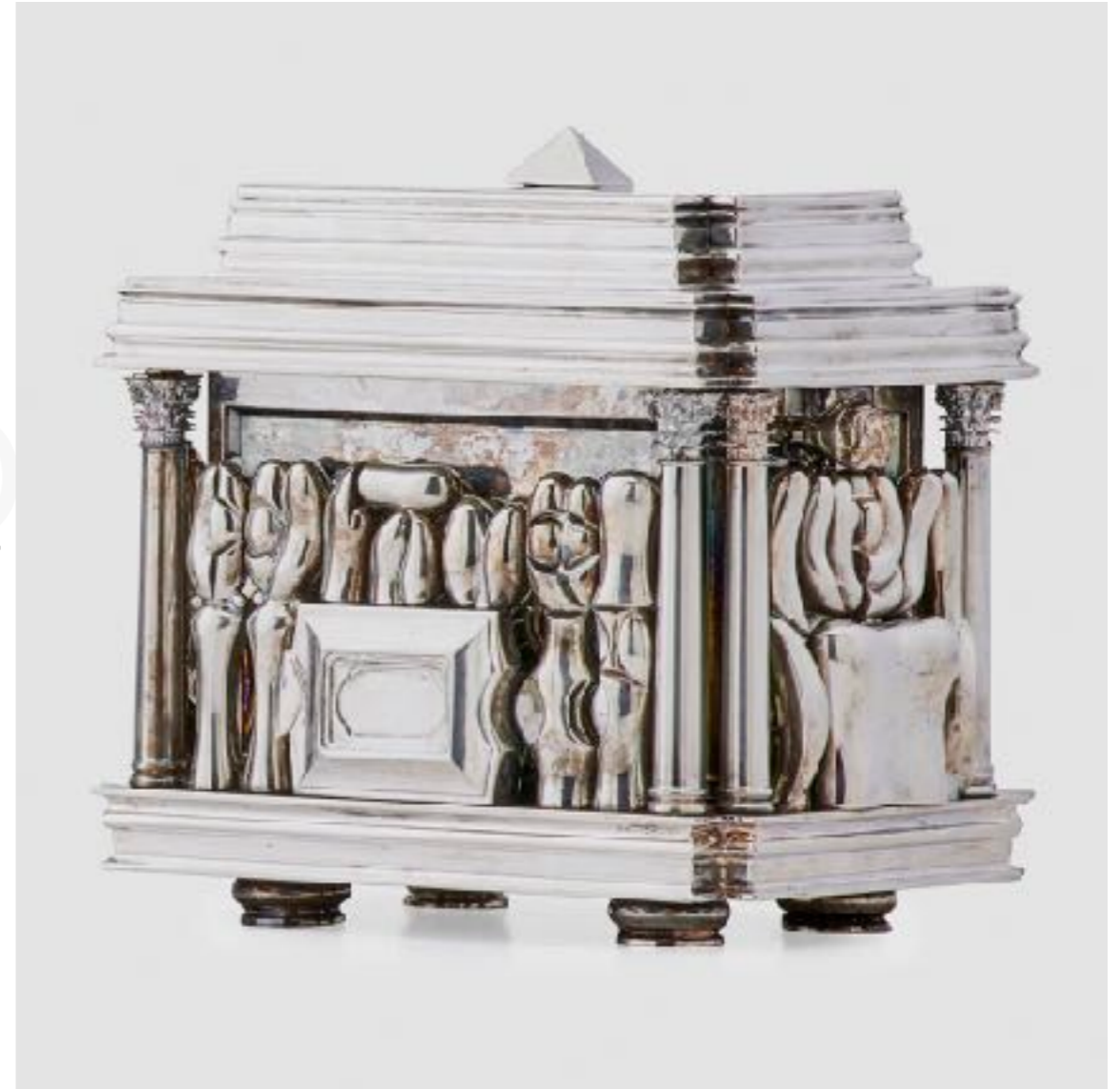
Miguel Ortiz BERROCAL (1933-2006), Il Cofanetto , métal argenté, 1969-75, 21.6 cm x 15.25 x 20.30 cm.