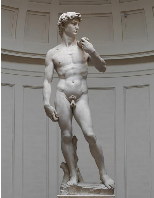
MICHEL-ANGE, David , 1501-1504, marbre, 517 x 199 cm, Galleria Dell'Accademia, Florence.

Vous allez découvrir une œuvre qui interroge le corps entre figuration et défiguration . Celle-ci questionne les axes du dépassement d'échelle et du monumental . Il vous est proposé d'identifier pourquoi cette œuvre fait débat.