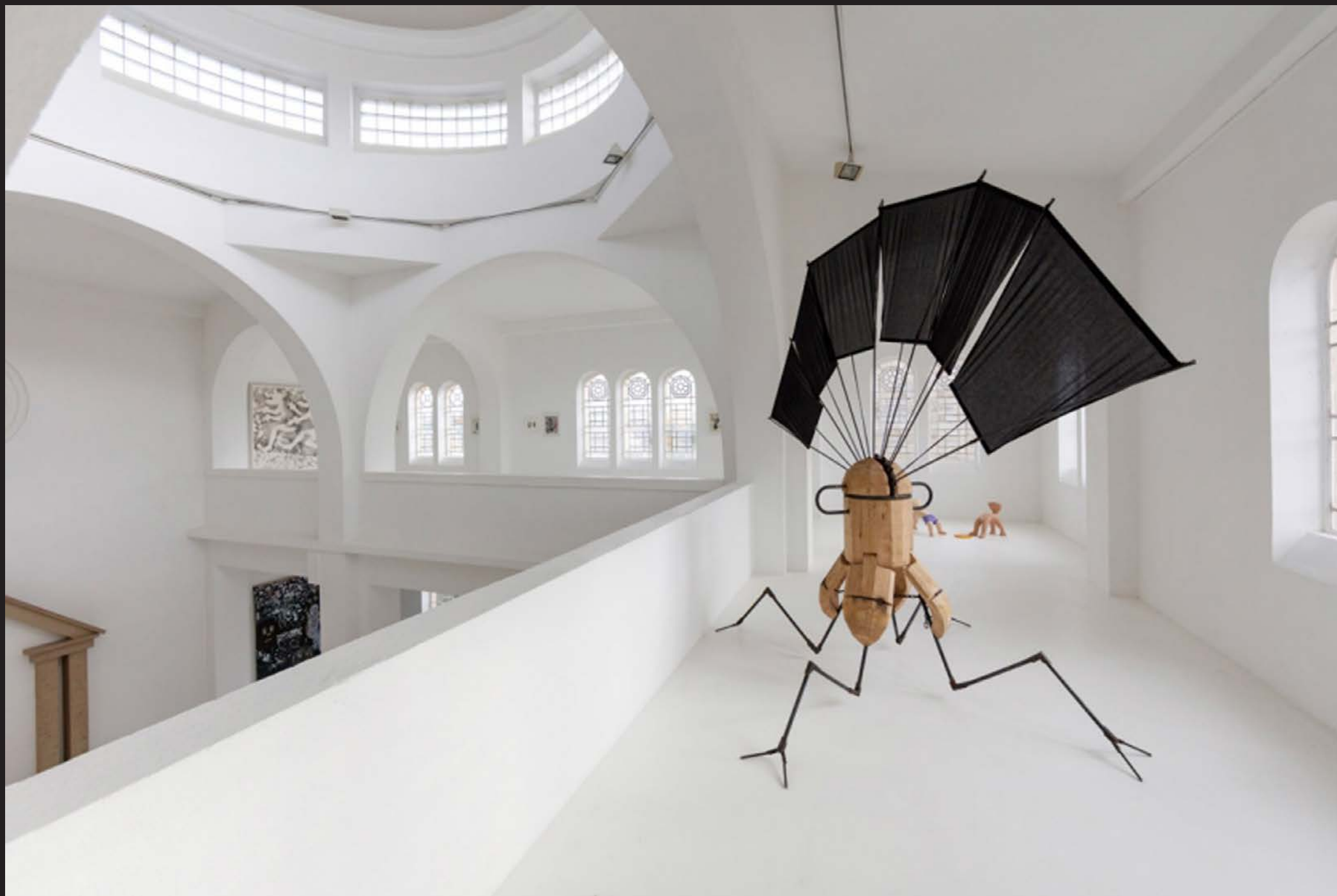
Vincent Chevillon, Inversion / Aversion , 2019