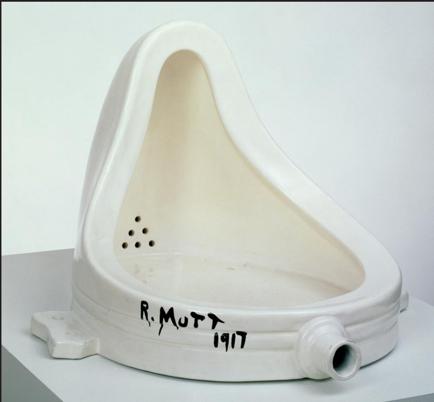
Marcel Duchamp, Fontaine , 63×48×35 cm, 1917