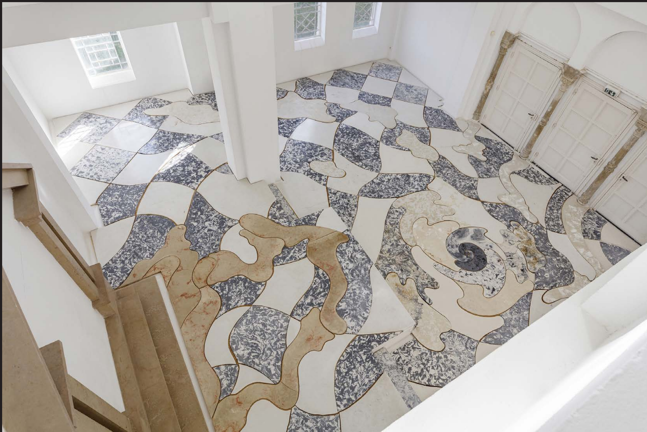
Zuzanna Czebatul, The Singing Dunes , 2020