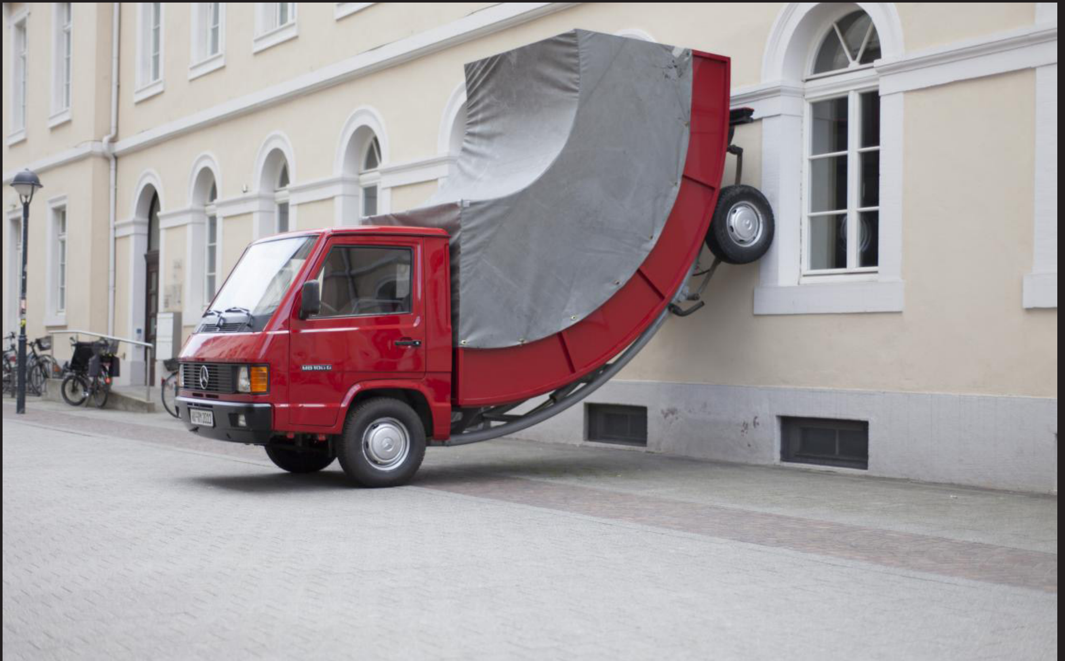
Erwin Wurm, Truck , ZKM Centre d'art et de technologie des médias de Karlsruhe, 2005