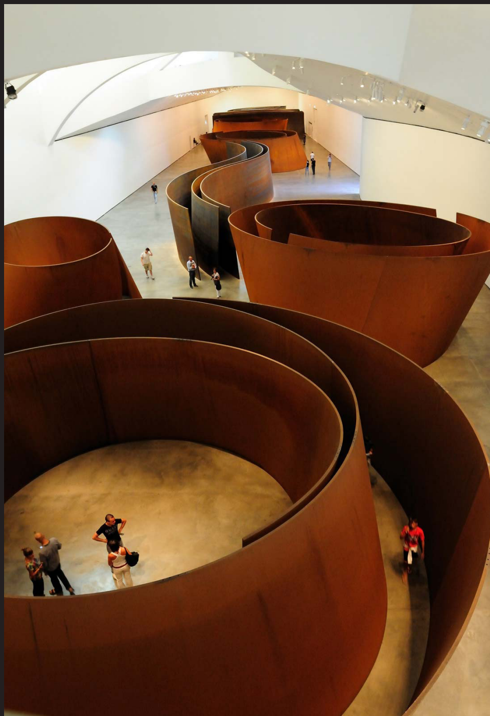
Richard Serra, La matière du temps , Musée Guggenheim, Bilbao, 1994 - 2002