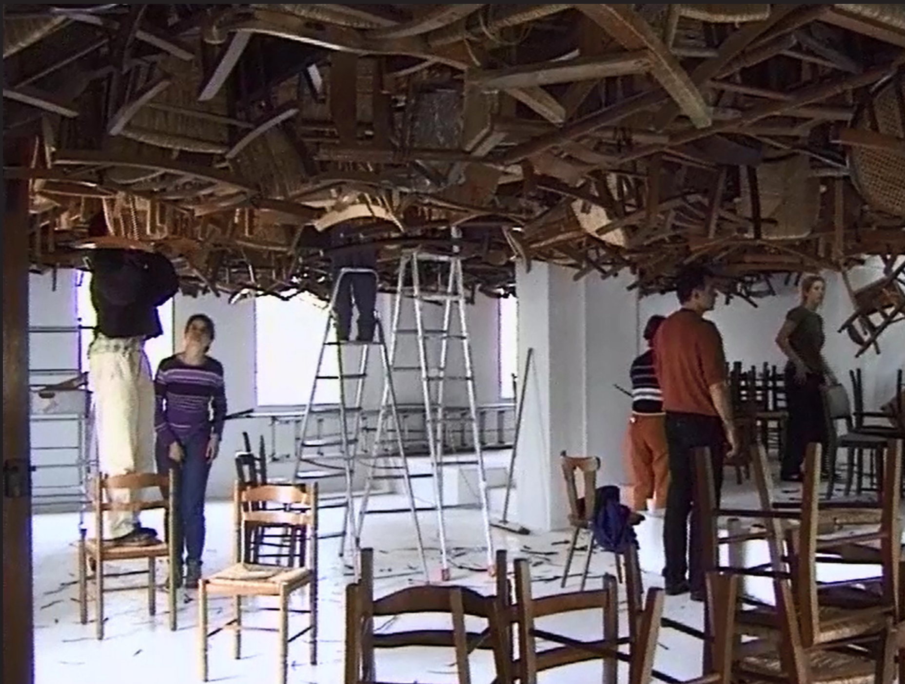
Tadashi Kawamata, Les chaises de traverse , 1998