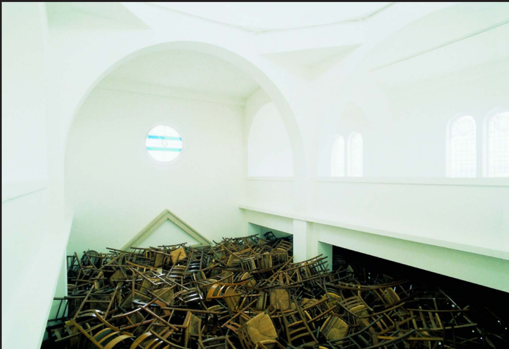
Tadashi Kawamata, Les chaises de traverse , 1998