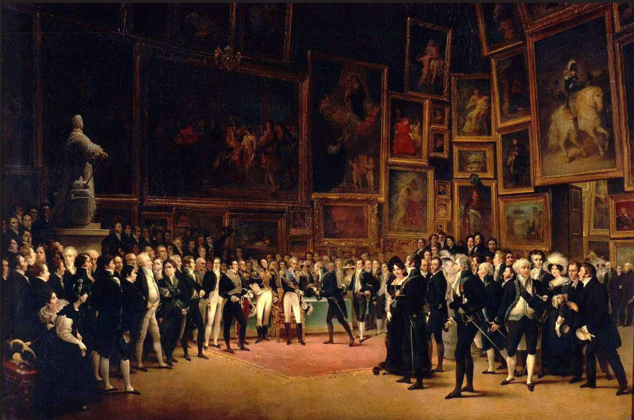
François-Joseph Heim, Charles X distribuant des récompenses aux artistes exposants du salon de 1824 au Louvre, le 15 janvier 1825 , 1865, Musée du Louvre, Paris, 2,09x2,86m