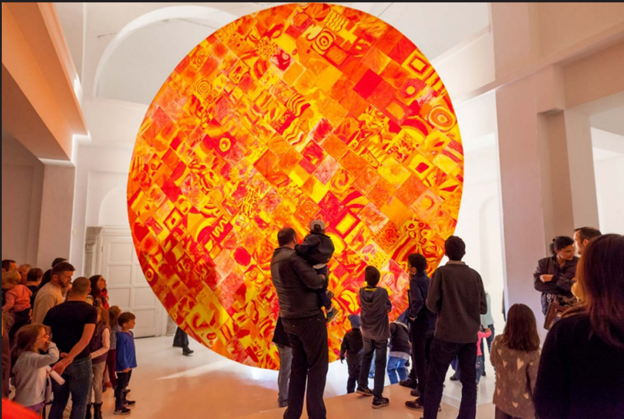
Matteo Rubbi, Voyages dans la mer perdue , 2017