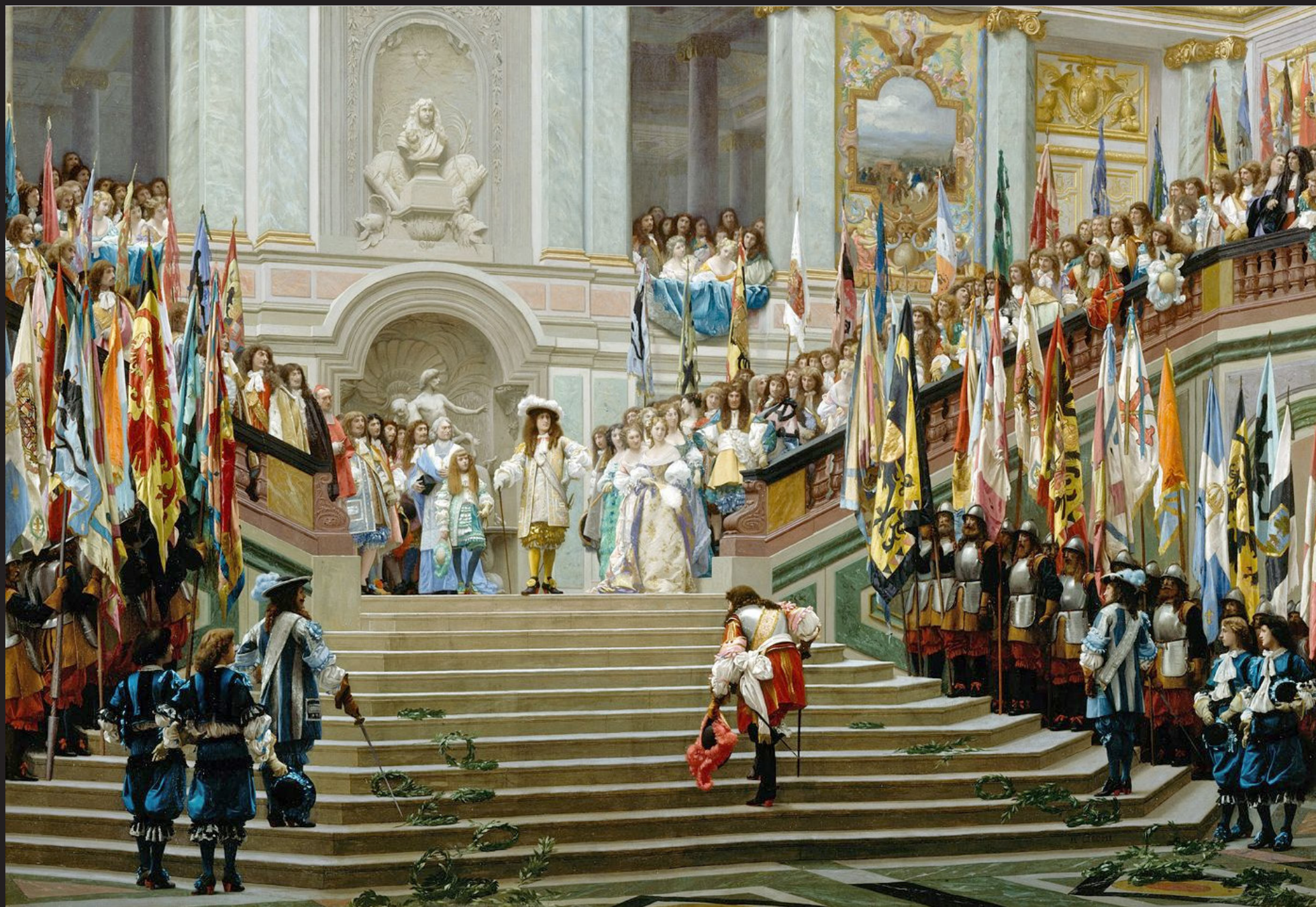
Jean-Léon Gérôme, Réception du Grand Condé par Louis XIV (Versailles, 1674) , 1878, Musée d'Orsay, Paris, 96cm x 1,4m