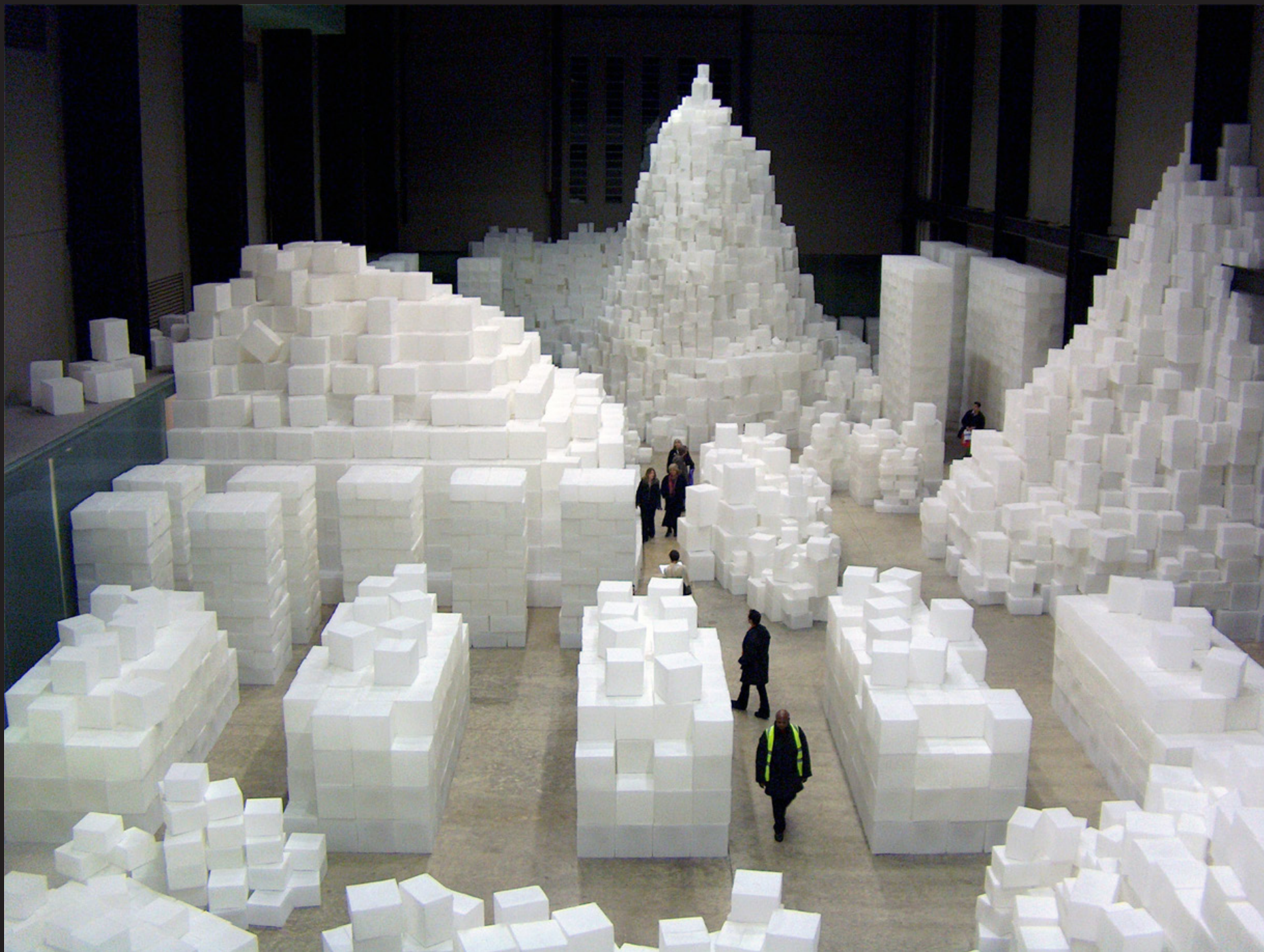
Rachel Whiteread, Embankment , Tate Modern, Londres, 2005