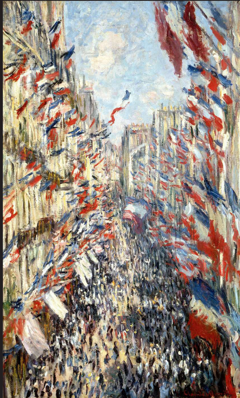
Claude Monet, La Rue Montorgueil à Paris. Fête du 30 juin 1878 , 1878, Musée d'Orsay, Paris 81 × 50 cm