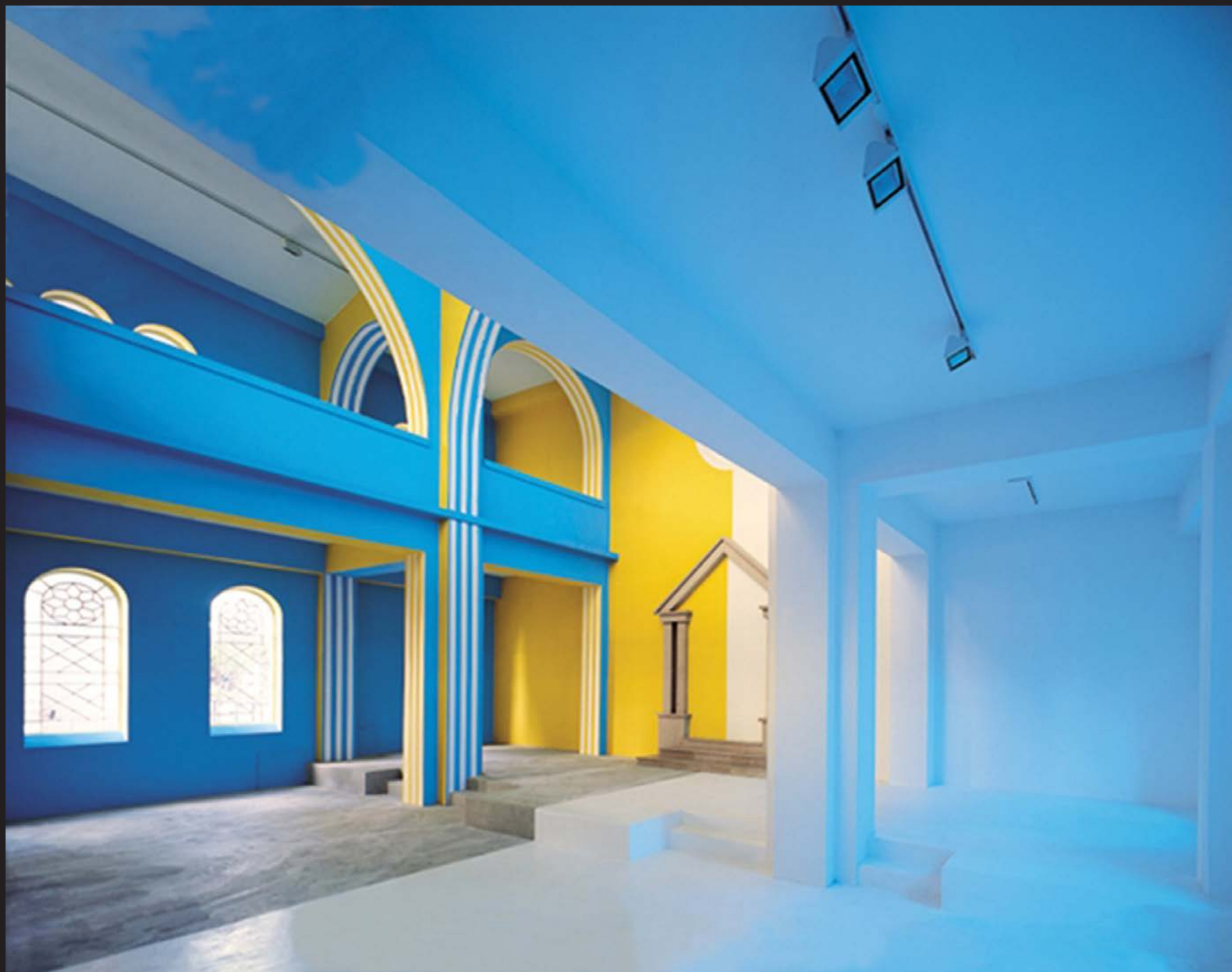
Daniel Buren, Glissements de la lumière sur la couleur... , 1997