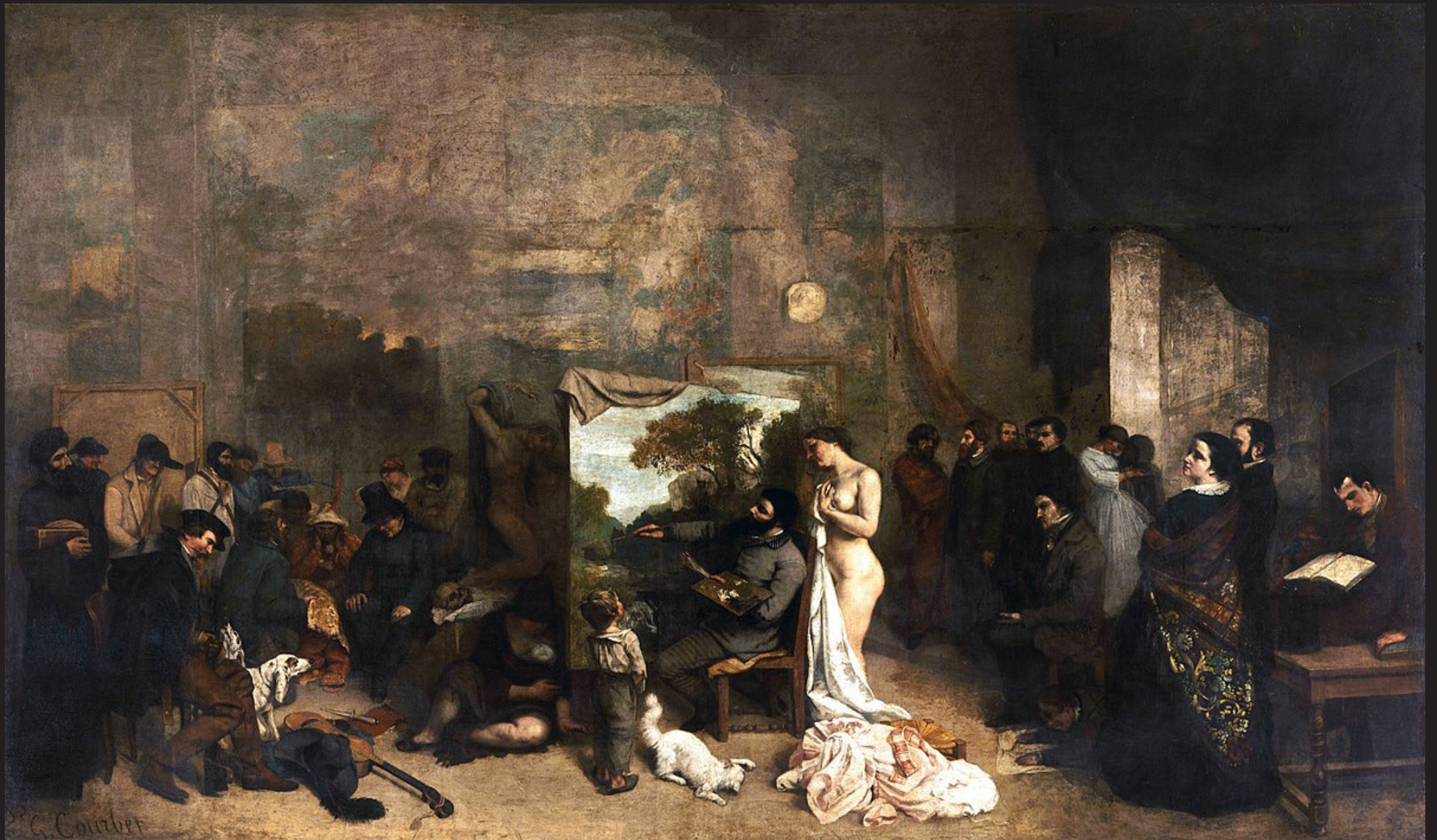
Gustave Courbet, L'atelier du peintre , 1855, Musée d'Orsay, Paris, 361x598 cm