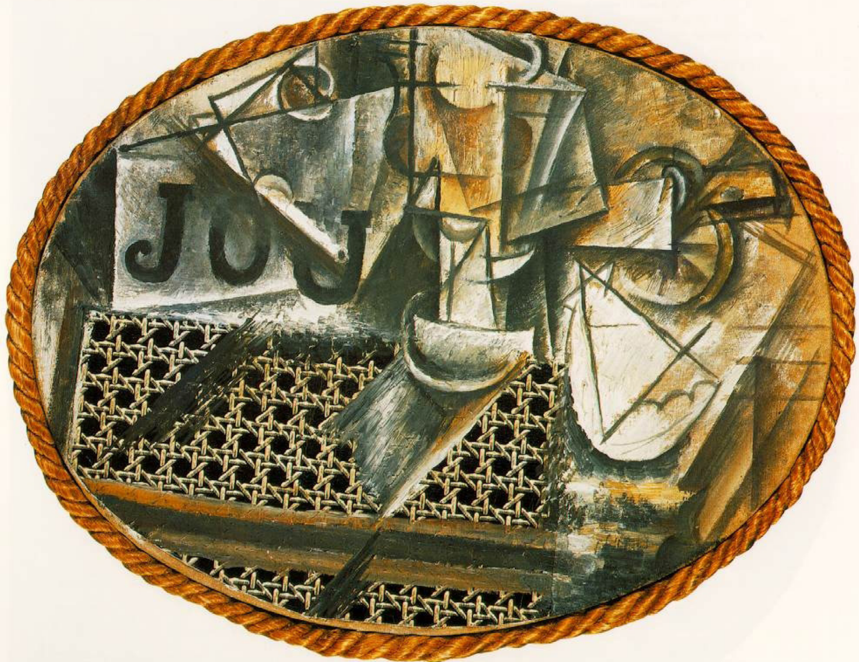
Pablo Picasso, Nature morte à la chaise cannée , 1912, Musée national Picasso, Paris, 29×37cm