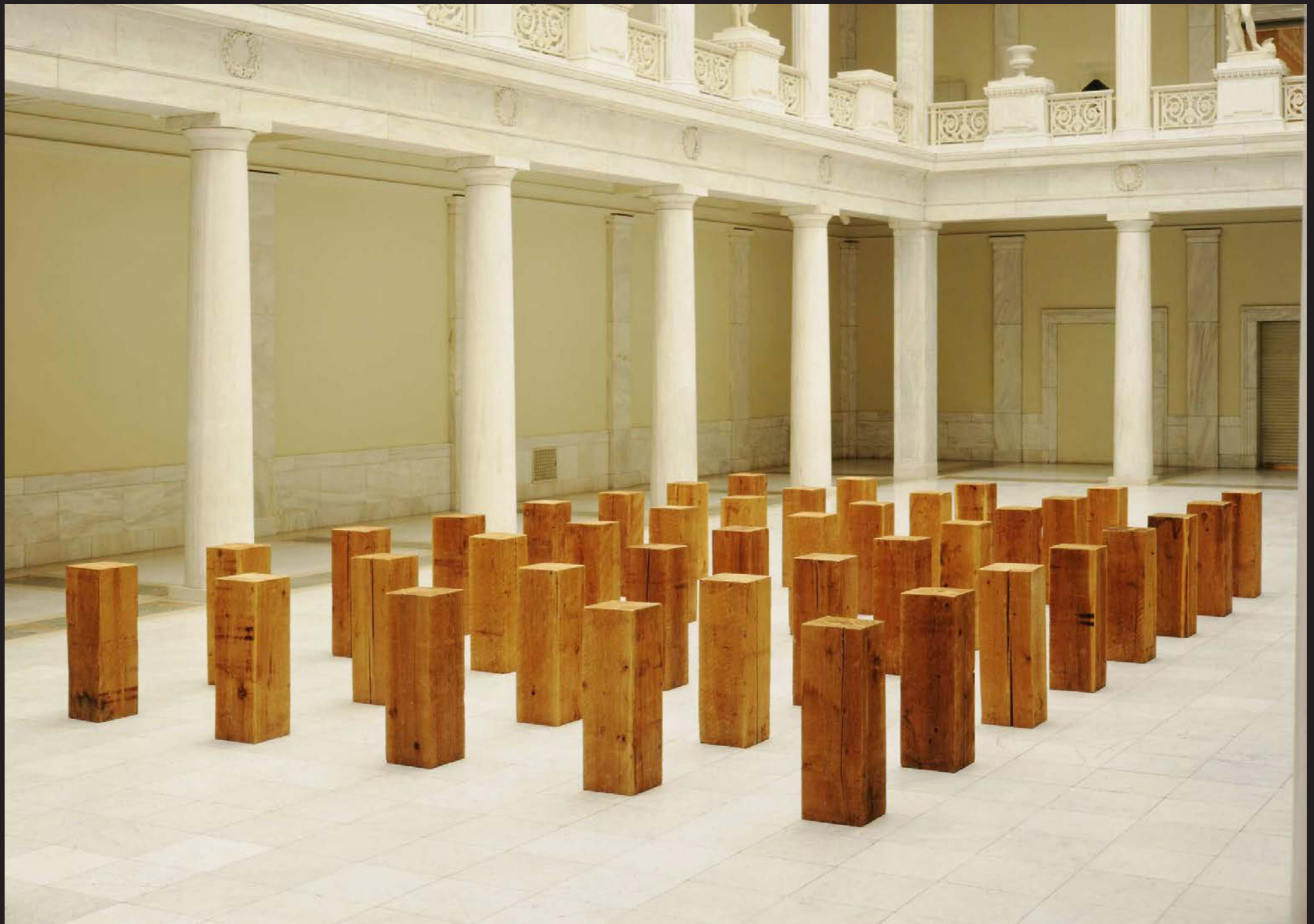
Carl André, Fallen Timbers , Musée d'art de l'Institut Carnegie, Pittsburgh, 1980