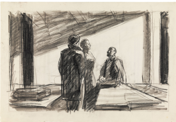
Edward Hopper (1882-1967)