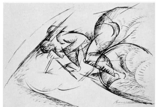
Umberto Boccioni, Dynamisme d'un cycliste (croquis), 1913