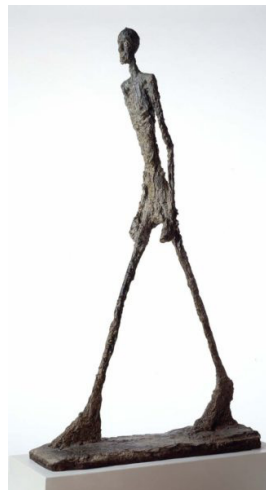
- Alberto GIACOMETTI (1901-1966), L'Homme qui marche I , 1959-1960