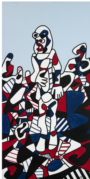
- Jean DuBUFFET (1901-1985), Promenade agreste , 1974