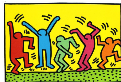
Keith Haring (1958-1990)