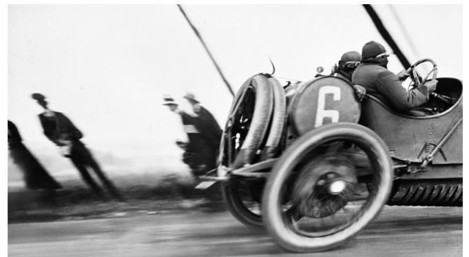
- Jacques Henri LARTIGUE, Automobile Delage, Grand Prix de l'Automobile-Club de France, 1912