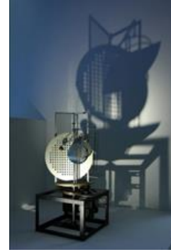
Laszlo MOHOLY-NAGY , Modulateur espace lumière (1930)

http://timnobleandsuewebster.com/artwerks.html