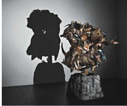
Tim NOBLE & Sue WEBSTER , English Wildlife (2000)

Corpus d'œuvres de références et modalités de présentation