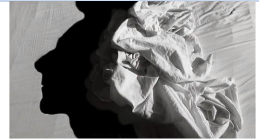
ALAIN FLEISCHER L'homme dans les draps , 2003 Vidéo https://www.youtube.com/watch?v=hrd2QKZ7L1c