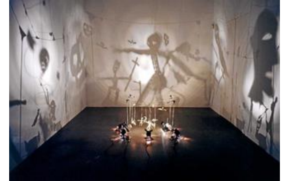
Christian BOLTANSKI , Théâtre d'ombres (à partir de 1984) https://www.youtube.com/watch?v=9KDM0B5zcE4