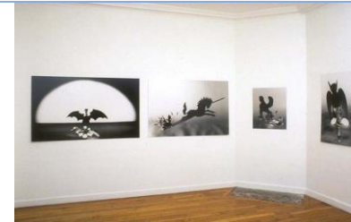
Vue d'ensemble de l'exposition

http://www.colettehyvard.com/petits_bolides.php http://www.colettehyvard.com/chimeres.php