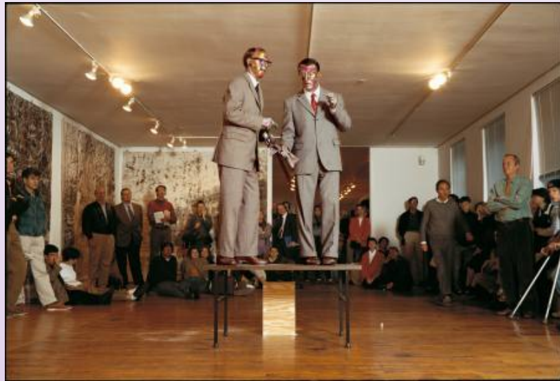
GILBERT & GEORGE, The Singing Sculpture , 1973