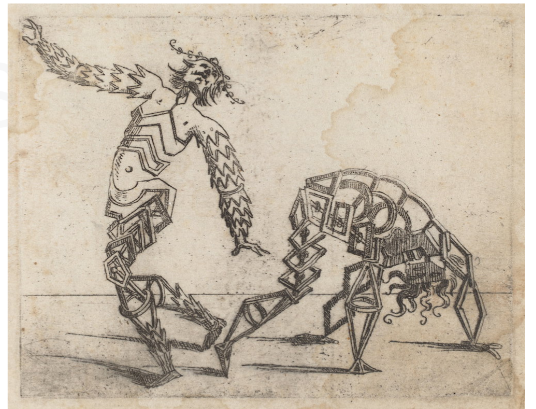
Giovanni Battista BRACELLI (1584-1650), Bizzarie di Varie Figure , 1624,8 x 10 à 11 cm, eaux-fortes sur papier.