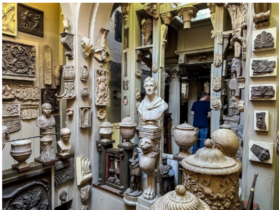
John Soane Museum, Londres.