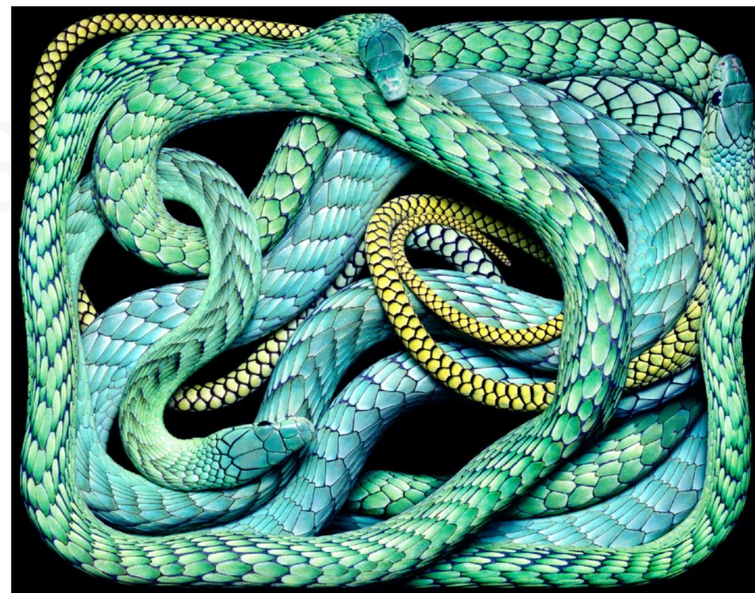
Guido Mocafico (né en 1962), Dendroaspis Viridis , 2003, tirage photographique, 90 x 70 cm. Collection privée.