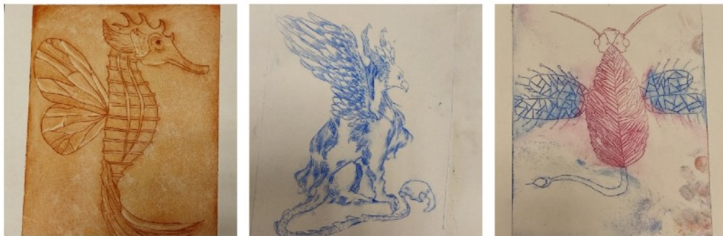
Les chimères des élèves de seconde : gravure sur rhéналon