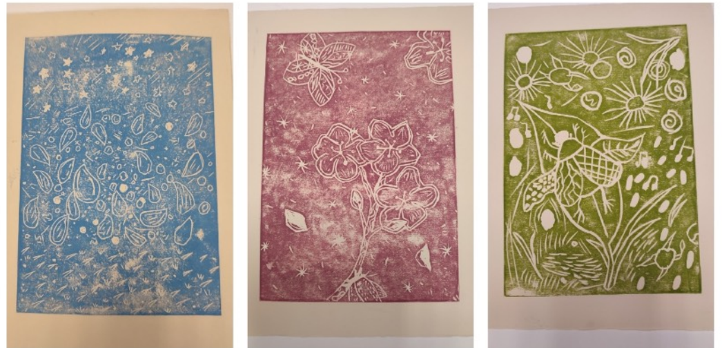
Nature, entre figuration et abstraction (d'après les haïkus des élèves) : linogravure