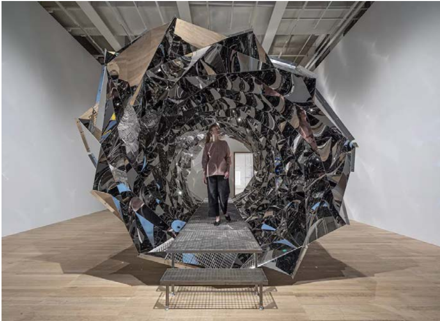
Olafur ELIASSON, Your Spiral View , 2002. Stainless-steel mirror, steel. Installation view: Tate Modern, London, 2019. Boros Collection, Berlin. © 2002 Olafur Eliasson.