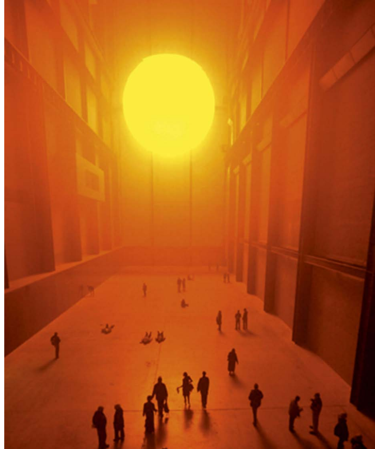
Olafur ELIASSON, zéro 2, the weather project , 2003