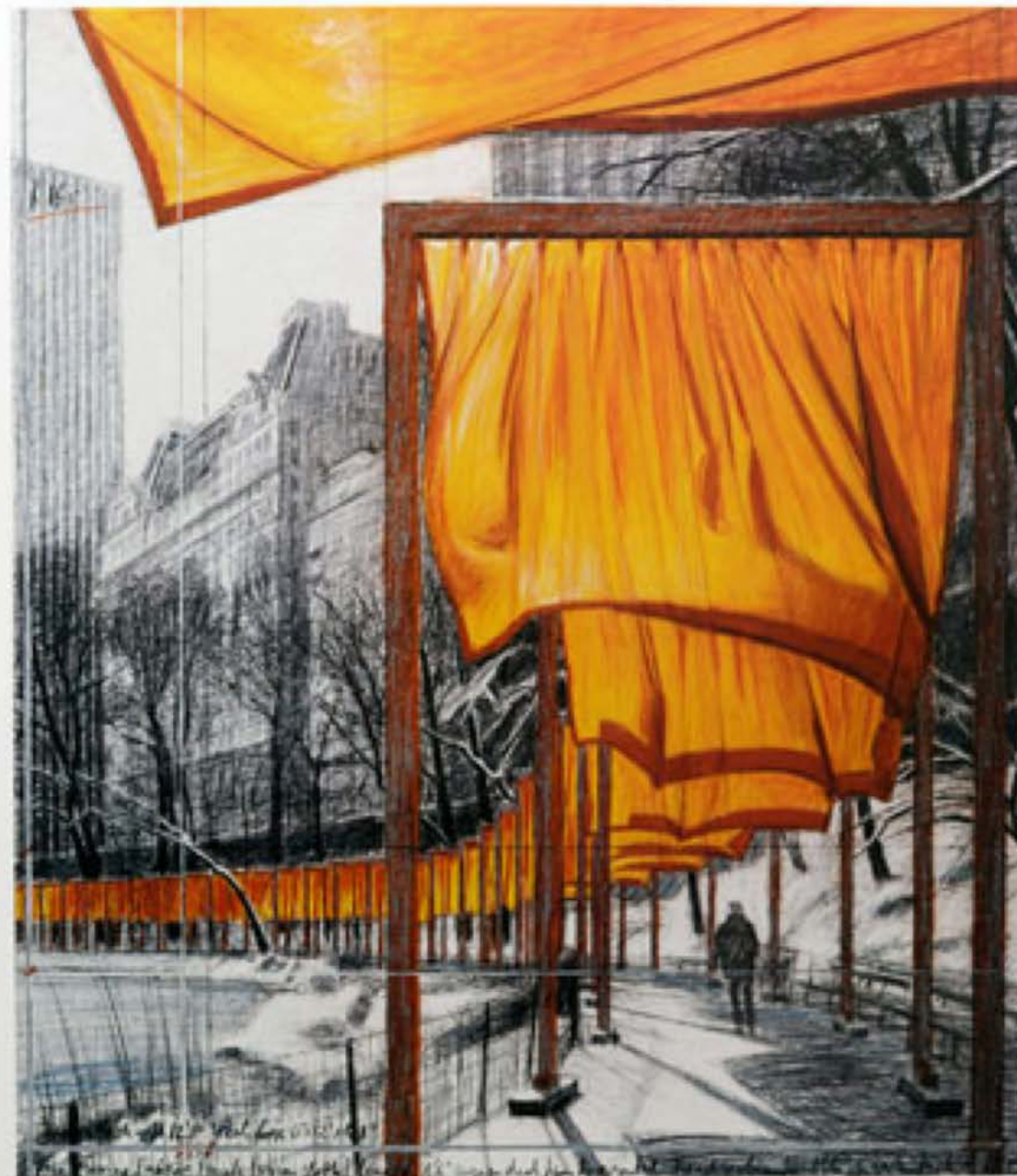
The Gateway (project for Central Park, NYC) Central Park's 5th Ave. Gateway, Park W. Park W. 100 ft (1990/91)