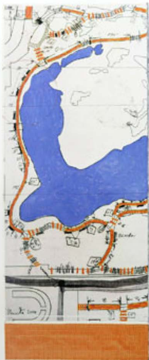
The Gateway (project for Central Park, NYC) Central Park's 5th Ave. Gateway, Park W. Park W. 100 ft (1990/91)