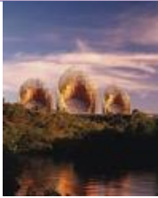
- Ernesto NETO, We stopped just here at the time , 2002.