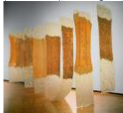
-Samir MOUGAS, Un chaînon manquant , 2009.