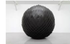
- Rirkrit TIRAVANIJA, Untitled (Asile flottant) , 2010.