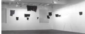
- Eva HESSE (1936-1970), Contingent , 1968-69