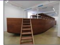
- Stefan EBERSTADT, Rucksack House (Maison sac à dos), 2004, 2,5 x 2,5m.