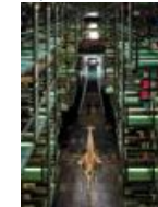
- Adel ABDESSEMED, Habibi , 2003