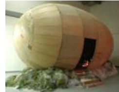
- Huang Yong Ping, Bat Project IV , 2005