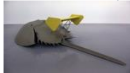
- El Anatsui, In the World But Don't Know the World , 2011. 560 x 1000 cm.