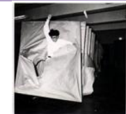
- Gabriel OROZCO, Mobile Matrix , Biblioteca Vasconcelos, Mexico, 2006