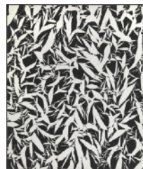
Simon HANTAÏ (1922 -2008), Études , 1969. 275 x 238 cm