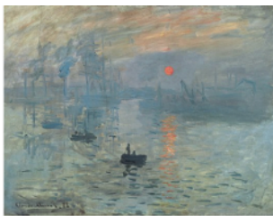
Claude MONET (1840-1926) Impression soleil levant , 1872. Huile sur toile , 48x63 cm