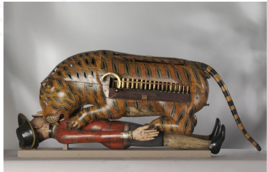
Tigre de Tipu , vers 1790, bois et métal, 178 cm x 71 cm x 61 cm, Victoria and Albert Museum, Londres.