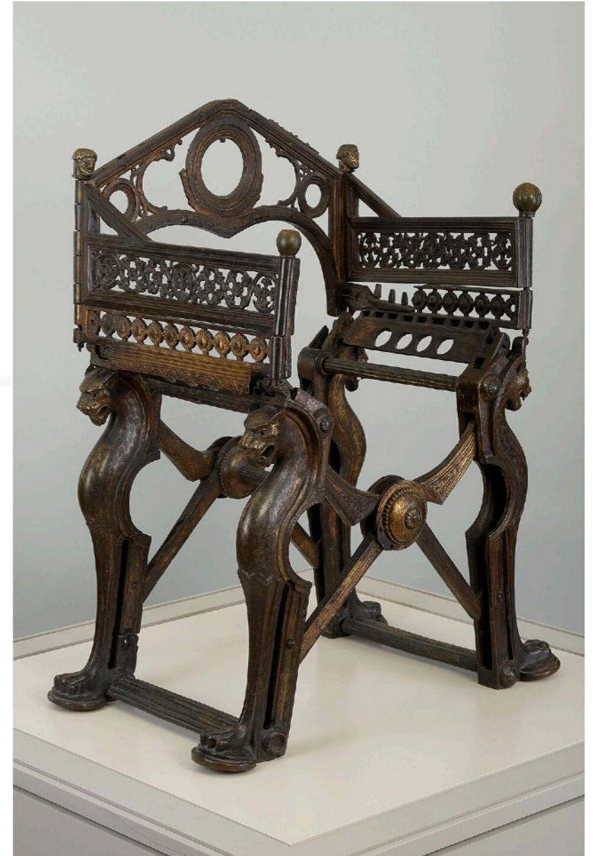
Trône de Dagobert , Haut moyen-âge, bronze et dorure, 104 x 82 cm, BnF, département des Monnaies, médailles et antiques, Paris.