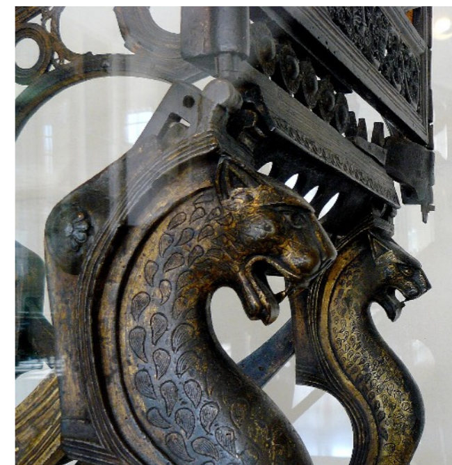
Monuments de Dagobert