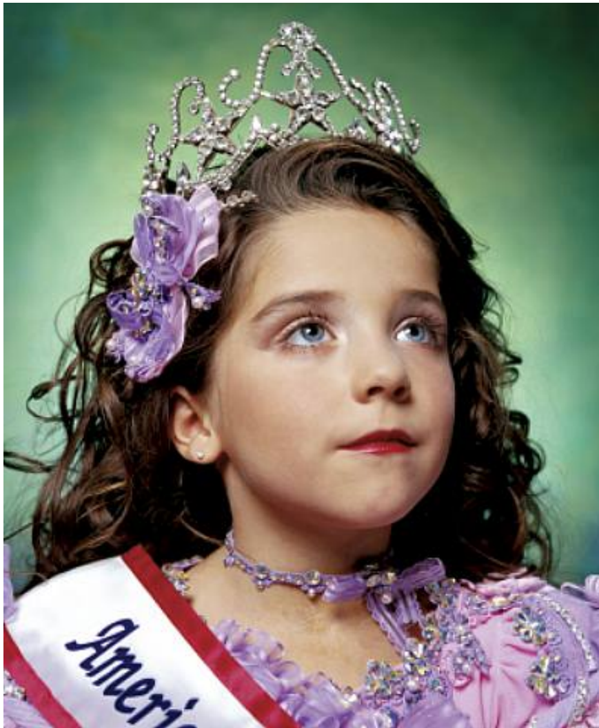
Andres SERRANO (né en 1950), America's little yankee miss (America) , 2003, photographie, 61 × 50,8 cm.

Les thématiques de travail d'Andres Serrano sont intimement liées aux questions relatives au corps et à la spiritualité. Le portrait allégorique de l'Amérique acquiert une dimension polémique qui surpasse l'apparent « angélisme » du modèle. Les yeux portés vers un horizon lointain et élevé font écho aux images pieuses de l'iconographie saint-sulpicienne. Figure archétypale de l'innocence, la jeune fille arbore le diadème et le sautoir qui en font la gagnante d'un concours d'incarnation: celui de l'Amérique blanche et chrétienne, clinquante et aseptisée, et qui nie la diversité ethnique et confessionnelle de sa population. En ce sens, le portrait n'est pas l'emblème d'une nation mais devient le mirage iconique d'un inquiétant état d'esprit ségrégationniste encore vivace.