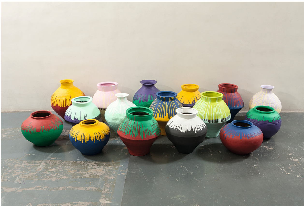
Figure de l'opposition au pouvoir chinois et emblème de la liberté d'expression, Ai Weiwei désormais réfugié au Royaume-Uni poursuit une œuvre engagée politiquement et aux forts retentissements médiatiques.

Ai WEIWEI (né en 1957), colored vases (vases colorés), vases de la dynastie Han recouverts de peinture industrielle, 2015, dimensions variables.