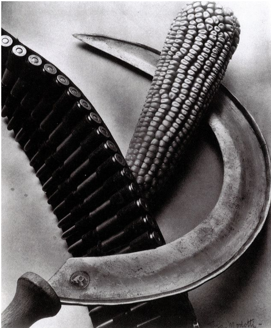
Tina MODOTTI ( 1896-1942), Cartouchière, Faucille et épis de maïs , 1927, photographie argentique

Le cadrage resserré sur une nature morte d'objets symboliques s'ancre dans la série de photographies engagées consacrée à la révolution mexicaine. Le maïs et la serpe, symboles de la réforme agraire en cours et du monde paysan dialoguent avec une cartouchière : la lutte armée revendiquée pour rompre avec un ordre social qui conforte les inégalités. Profondément acquise aux idées communistes, Tina Modotti fait jouer à la serpe un double discours, renvoi évident à la révolution soviétique dont elle est devenue l'un des emblèmes. La composition entrecroisée des objets n'est pas anodine, elle accentue le pouvoir symbolique des objets et les logiques de causes et d'effets de la révolution.