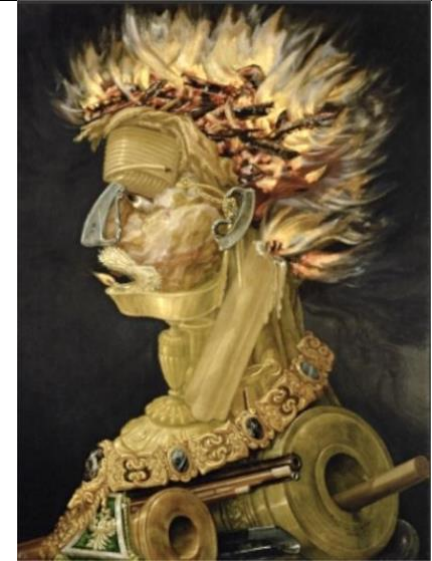
Giuseppe ARCIMBOLDO, Allégorie du feu, série des 4 éléments , 1570, huile sur toile