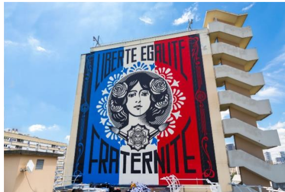
Shepard FEREY (OBEY), Liberté, égalité, fraternité , 2015, 13 ème arrondissement, Paris