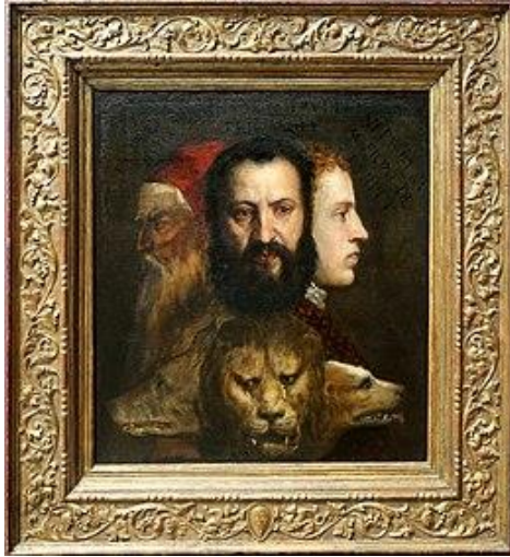
TITIEN, Allégorie du temps gouverné par la puissance , 1565, huile sur toile