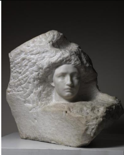
Auguste RODIN, L'aurore , 1895-97, marbre