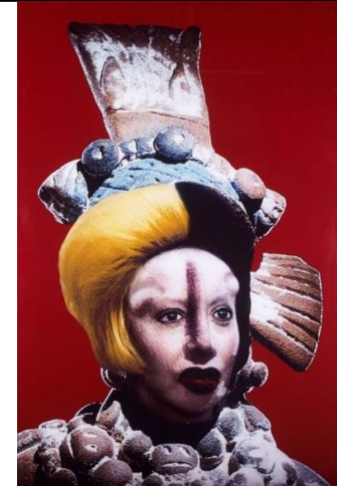
ORLAN, Défiguration -refiguration-self-hybridation précolombienne n°27 , 1998-99, photographie