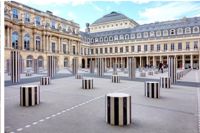
Daniel BUREN, Les Deux Plateaux , 1986. Marbre blanc et noir, plan d'eau. Installation - Cour d'honneur du Palais Royal, Paris.

https://www.parisladouce.com/2018/11/paris-les-deux-plateaux-grandeur-et.html