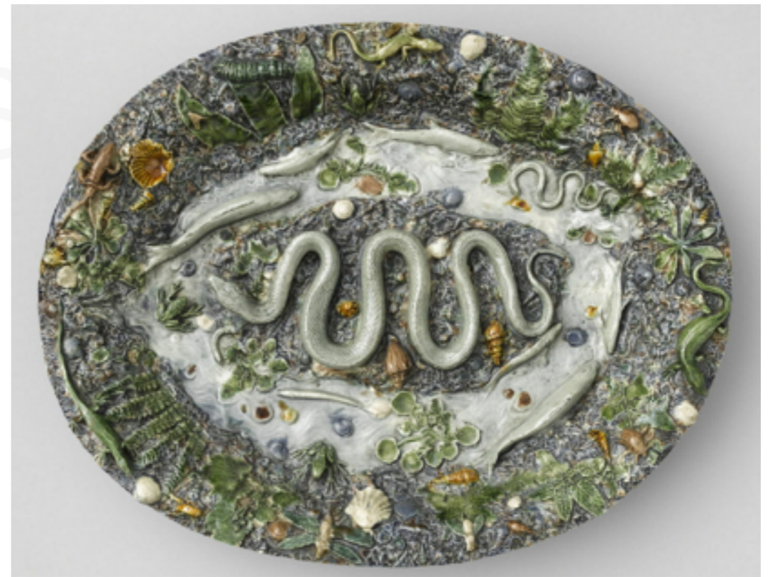
Bassin ovale à figulines , vers 1600-1650, céramique à glaçure plombifère, 7,8 x 52,5 cm x 40,5 cm, musée du Louvre, Paris.