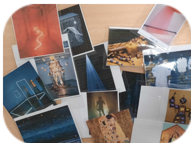
La LUMIERE dans l'art