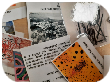
GESTES et REPETITION dans l'art