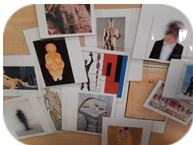
Le CORPS dans l'art