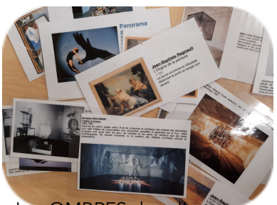
Les OMBRES dans l'art