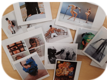
Les PROTHÈSES dans l'art