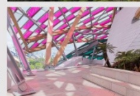
L'Observatoire de la lumière travail in situ éphémère Du 11 mai 2016 au 2 mai 2017 Fondation Louis Vuitton, Paris