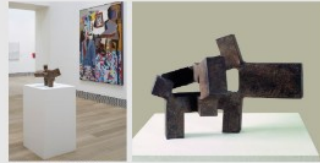
Abrazador del viento 1 , 1964 Fer forgé 43,9 x 52,1 x 35,6 cm Musée des beaux Arts d'Asturias