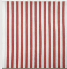
Peinture (Manifestation 3) mai 1967 Toile de coton, peinture à l'acrylique 252,3 x 252,3 cm Première présentation : Manifestation 3, Théâtre du Musée des arts décoratifs, Paris, le 2 juin 1967 Toile de coton à rayures blanches et rouges, alternées et verticales de 8,7 cm (1 ou 0,3) de large chacune, dont les deux bandes extrêmes colorées sont recouvertes de peinture acrylique blanche au recto