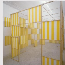
Cobain éclairée n°6 - les derniers Avril 1985 Bois, toile de coton à rayures blanches et jaune d'or alternées et verticales de 8,7 cm chacune (1/0,3), toile de coton blanche, peinture acrylique blanche, colle Travail situé, réalisé chez Ugo Ferranti, Rome, 1985