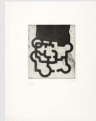
Nomenae e Sir Delano Perose 1981, Estampes Plats: 29,2 x 25 cm Sheet: 65 x 50 cm