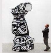
Chien de guet I 1969 - 2016 Sculpture en Polyuréthane peint sur de la résine epoxy 312,5 x 155 x 112,5 cm