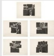
Entre / Between Estampes, Sheet - 13,5 x 96 cm, Plats - 40 x 40 cm, 1960, Galeria Sekourie, J. & W