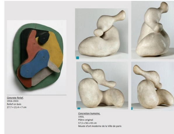
Concrete Relief 1916-1923 Relief en bois 27,7 x 21,4 x 7 cm