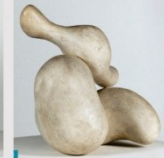
Concrete Relief 1933 Plâtre original 57,5 x 56 x 43 cm Musée d'art moderne de la Ville de Paris