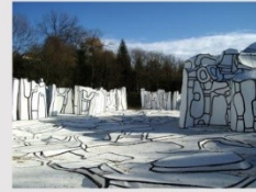
La Closerie et villa Faribola Epoxy et béton peints en polyuréthane 1971-1973 terminée en 1976 Fondation Jean Dubuffet, Périgny sur Yverres, France