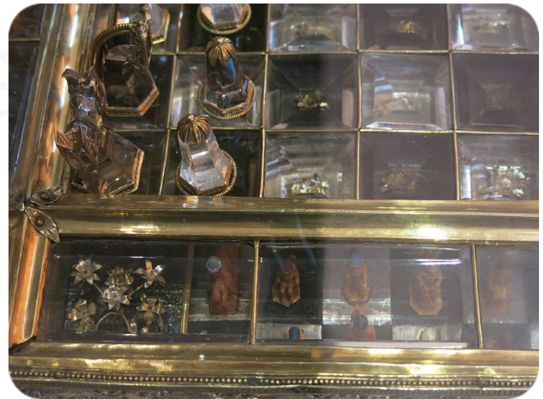
Échiquier de Saint Louis , vers 1490, argent doré, cristal de roche, quartz fumé, buis sculpté et émail, 43,5 x 43,4 cm, musée du Louvre, Paris.