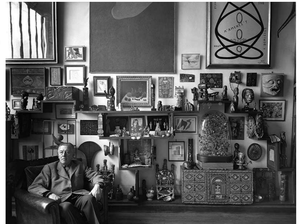
André Breton (1896-1966), Le mur de l'atelier , 1929-1960, reconstitué au centre Pompidou Paris.