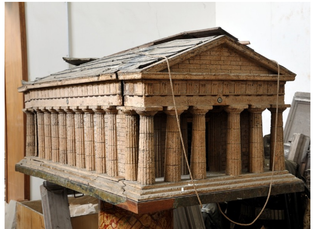
Lorenzo Taglioni , Le temple de Neptune , 1871, liège et matériaux divers, 200 x 200 cm (déplié). Musée san Martino, Naples.