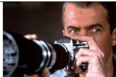
Alfred Hitchcock – 1954 - Fenêtre sur cour

Bande-annonce du film : https://www.youtube.com/watch?v=GrtW95YmXmg