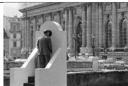
Peter Greenaway - 1994 - Stairs 1 Geneva