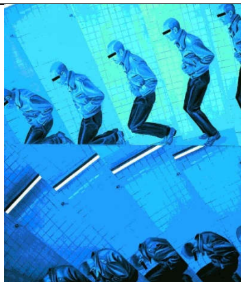
Jacques Monory – 1968 – Meurtre n-2

Corpus artistique (culture ancienne, moderne et contemporaine) https://sites.ac-nancy-metz.fr/arts-plastiques/wp-content/uploads/1_CORPUS_FICHES-DE-LINSPECTION-2.pdf