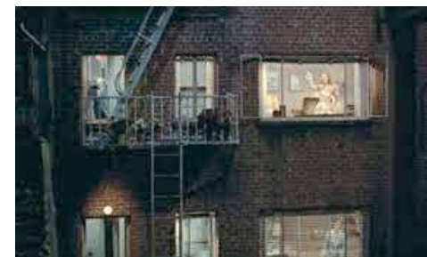
Fenêtre sur cour : Trois scènes visibles simultanément

Bande-annonce du film : https://www.youtube.com/watch?v=GrtW95YmXmg