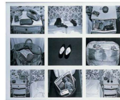
Sophie CALLE – 1983 - L'hôtel, chambre 26

*Réalizations d'élèves (pour la journée 3 en Mars ou à partir de séquences déjà réalisées)