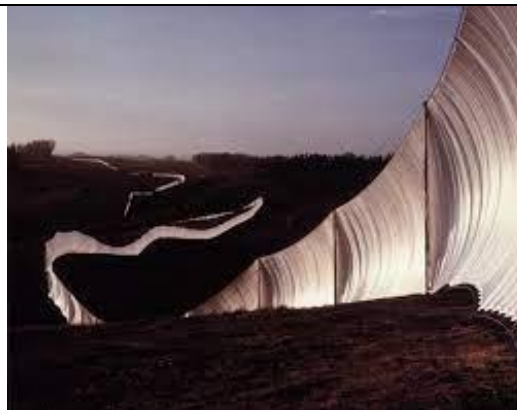
Christo et Jeanne Claude Running Fence Sonoma and Marin Counties Californie, 1972 – 1976 Ensemble dissociable