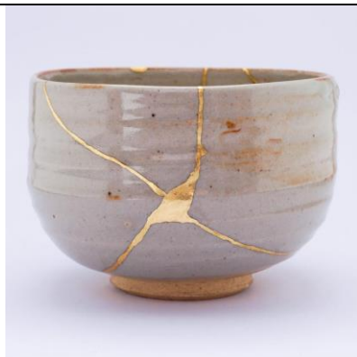
Art ancien du Kintsugi, Japon, XV ème siècle

https://sites.ac-nancy-metz.fr/arts-plastiques/wp-content/uploads/1_CORPUS_FICHES-DE-LINSPECTION-2.pdf