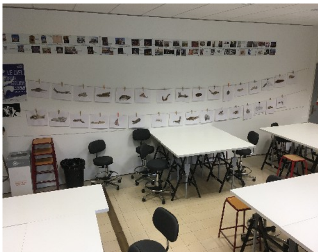
Frise chronologique et accrochage de travaux