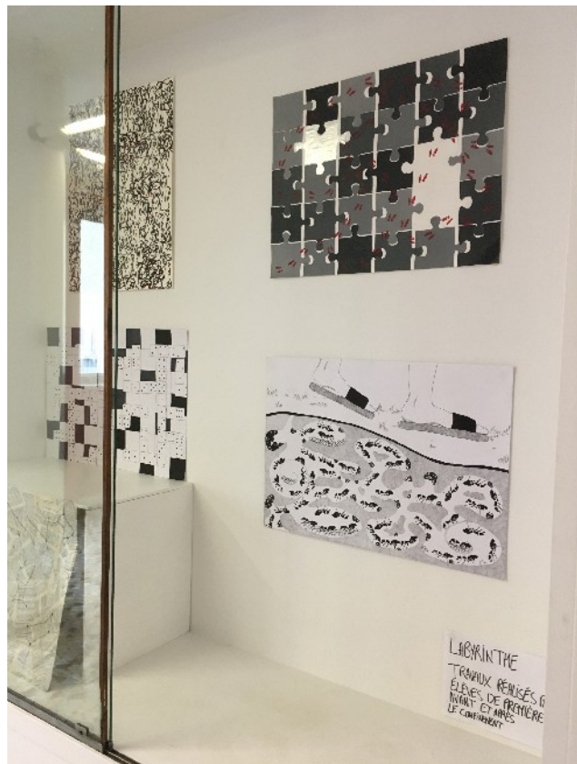
Vitrine d'exposition 1