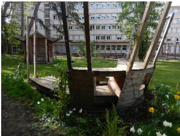
Le banc, les plantations et l'abri