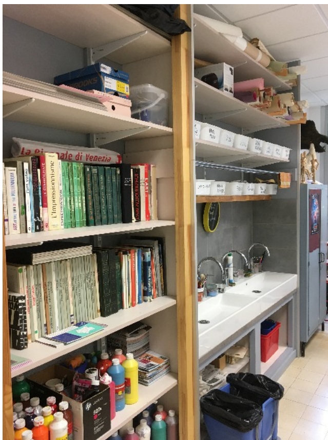
Les étagères et le point d'eau