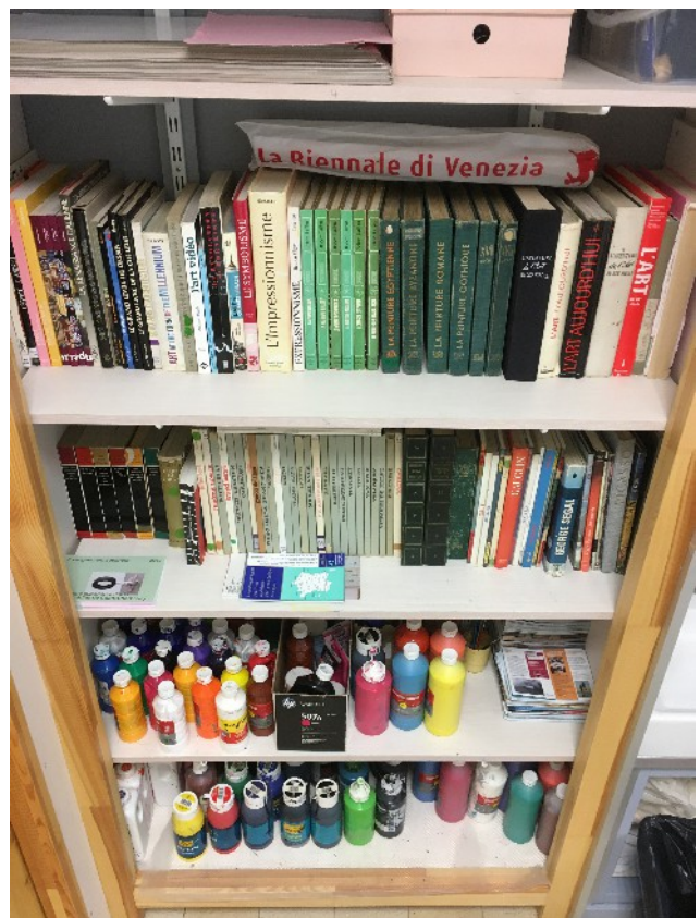
La bibliothèque et le stock de peintures