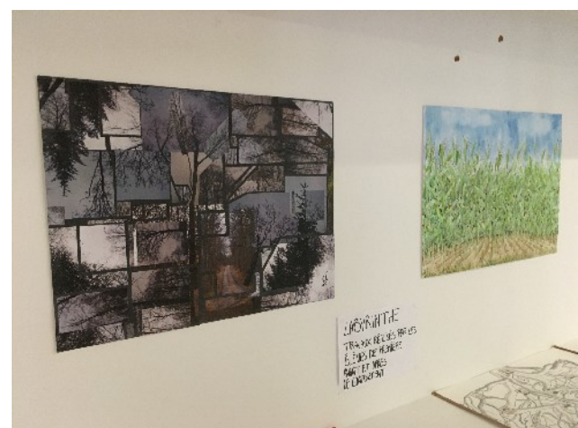
Vitrine d'exposition 2