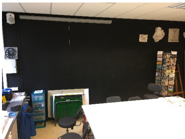
Le tableau noir

L'espace Chop'art , situé dans le hall de l'entrée principale du lycée Chopin (site Blandan) permet, tout au long de l'année, la mise en valeur des travaux réalisés par les élèves.