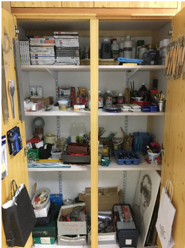
Le matériel pour la pratique