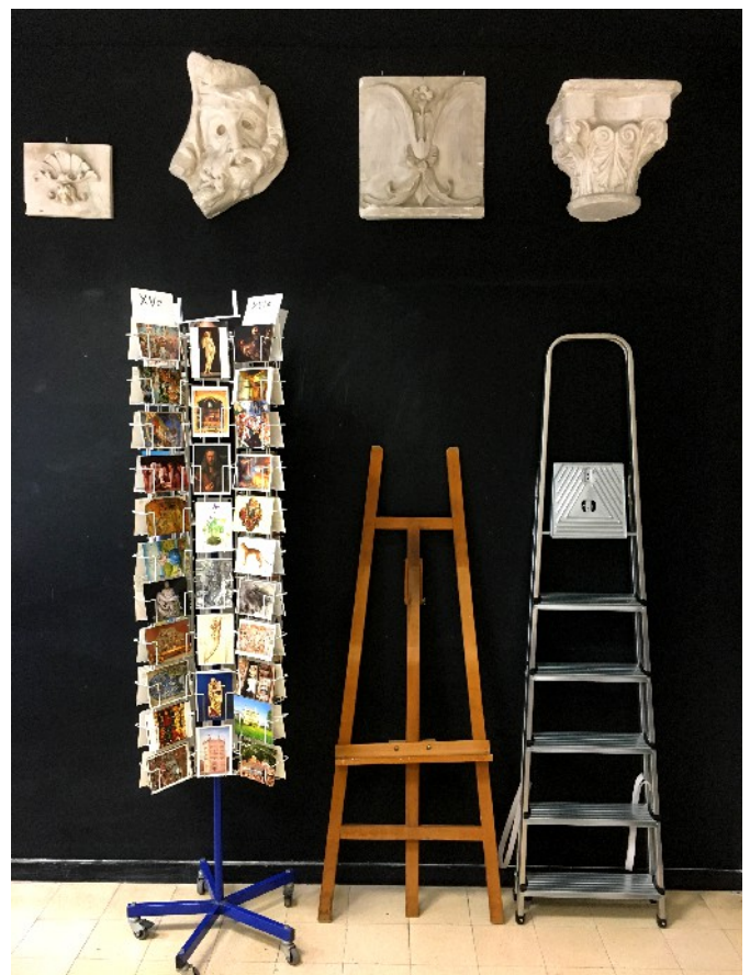
Moulages et cartes postales