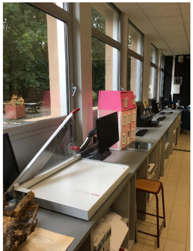
Le coupe papier