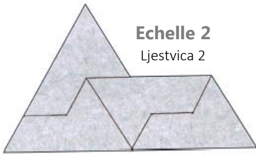
Echelle 2 Ljestvica 2