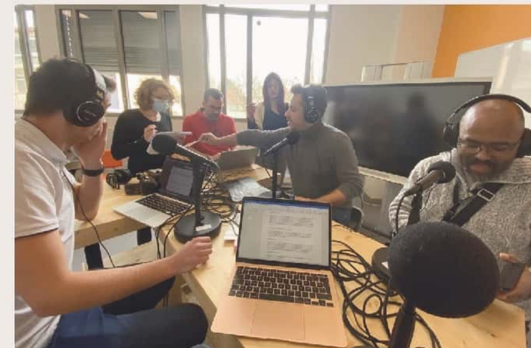
Première expérience radio pour certains...