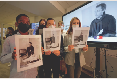
Hommage à Samuel Paty dans un collège