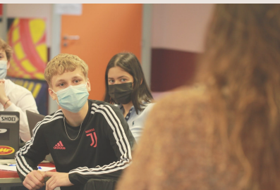
La conférence de rédaction des Abibac.

Mettez deux lycées, deux sections Abibac, plusieurs professeurs impliqués, trois titres de presse luxembourgeois, allemand et français, une journaliste motivée et pédagogue : vous obtenez une recette qui ne tient pas du miracle, mais qui fonctionne à merveille. Le projet «Journalistes transfrontières» vise à sensibiliser les élèves aux regards croisés franco-allemands sur la société d'aujourd'hui par le biais de la rédaction journalistique. Guidés par une journaliste luxembourgeoise, les élèves découvrent par l'activité de rédaction en équipe la complexité des questions actuelles dans leur dimension transfrontalière. Ils s'approprient les codes de l'écriture de presse. Leurs articles sont publiés dans le supplément trilingue « Extra » des quotidiens de la Grande Région Saar-Lor-Lux : République Lorrain, Tageblatt, Saarbrücker Zeitung.