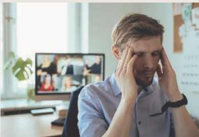
Risques de saturation, de désinformation, de baisse de productivité, de stress et de burn-out : le coût financier et humain de l'infobésité est patent.

Chacun de nous s'est déjà questionné sur le faible intérêt des jeunes élèves face aux grands enjeux du monde contemporain ; d'ailleurs, n'avons-nous pas décidé de les éveiller aux questions qui agitent la société ? Il est néanmoins possible de prendre le problème dans l'autre sens. Eux comme nous, ne souffrons-nous pas d'infobésité ? Ce concept paraît très moderne, mais il existe pourtant depuis les années 70 : il est défini comme une surcharge informationnelle, un excès d'informations qui entraîne une pollution des cerveaux. Souvent étudié dans le monde de l'entreprise, il peut également être décliné au monde des médias en parlant de surabondance, imputée aux chaînes d'information en continu, aux nouvelles technologies... Cela se quantifie d'ailleurs assez mal : on sait que l'humanité produit toujours plus d'informations, et que le volume de données numériques est en croissance exponentielle, si bien que l'on parle en yottabyte, «une mesure impossible à évaluer tant elle est astronomique». Et des risques, il y en a, pour tout le monde : paradoxalement, cela peut causer une désinformation devant un nuage informationnel qui baisse la qualité de l'information, jusqu'au surmenage... Le savoir analytique tendrait à s'effacer au profit d'une forêt d'associations d'idées. Et là, on perçoit le danger pour les élèves !