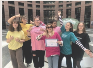
Les lycéennes de Tomblaine lors de la remise des prix Europorters à Strasbourg en 2022.