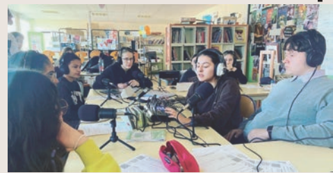
L'atelier radio du collège Pierre Adt, qui se réunit une fois par mois (même chose à l'école).