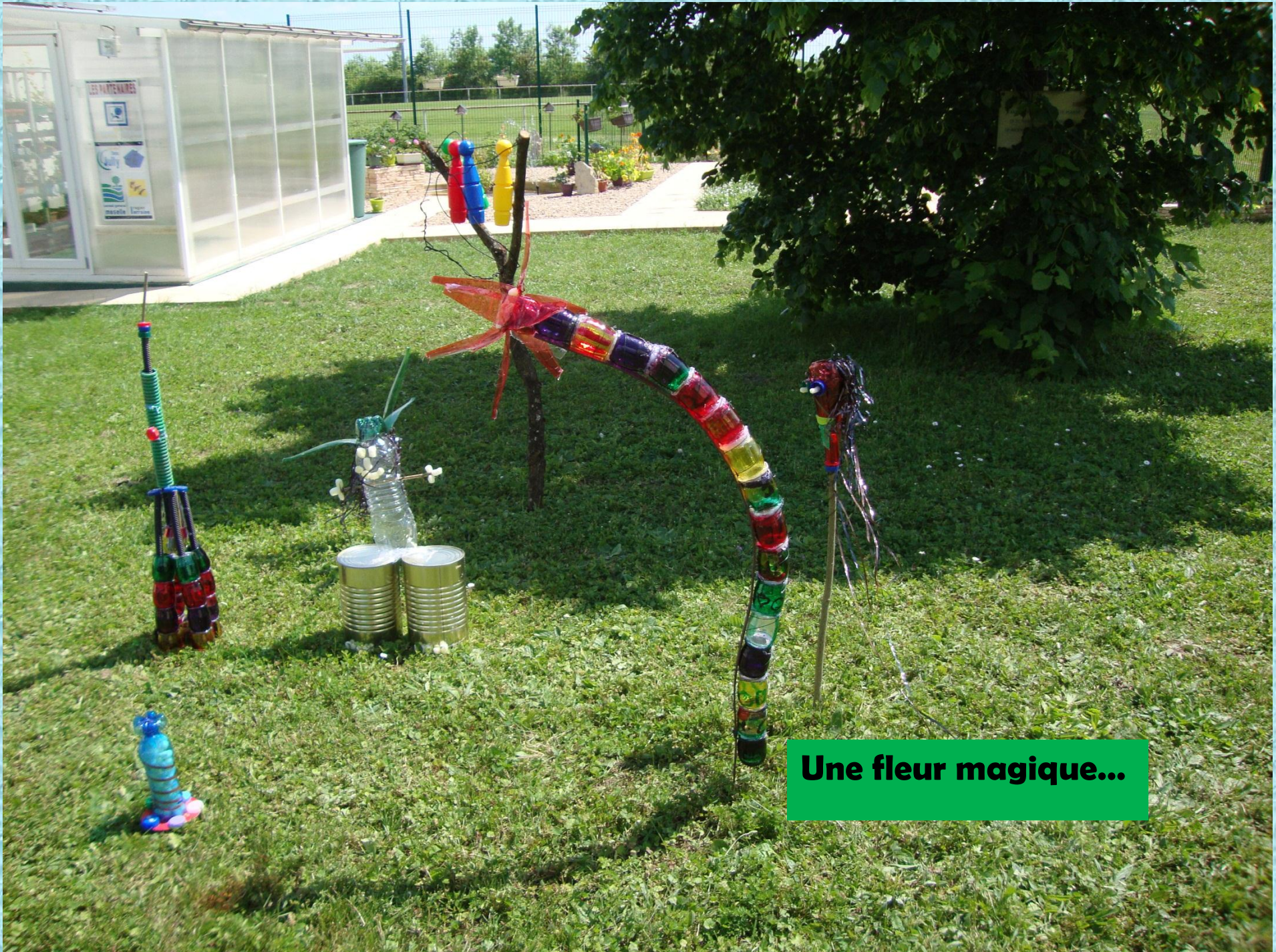
Une fleur magique...