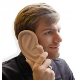
sert à cacher son téléphone ! La housse téléphone qui