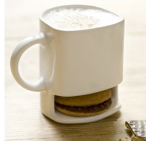
La tasse a gâteaux qui stocke les gâteaux !