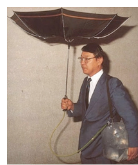
Il sert à récupérer l'eau de pluie ! L'EnfoPara :