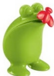
C'est une grenouille ruban ! Non, non ce n'est pas une vraie !