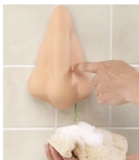
Il sert à se mousser ! Le nez-savon :