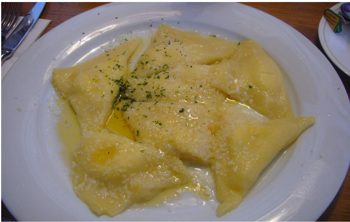
KÄSEMAULTASCHEN MIT BUTTERSOÛE