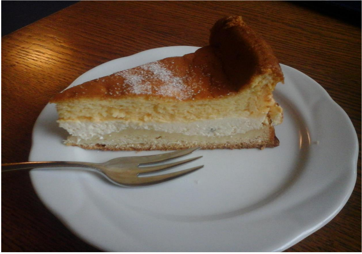
EIERSCHECKE KUCHEN (aus Sachsen)