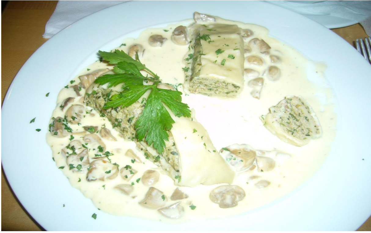
SPINATMAULTASCHEN MIT PILZEN