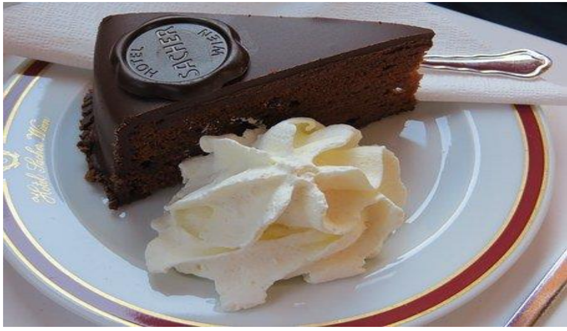
SACHERTORTE AUS WIEN