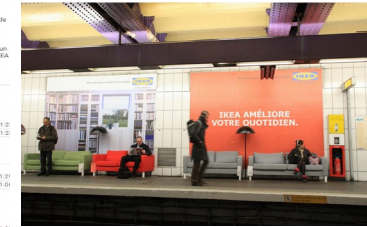
Action dans le Métro à Paris Flick.com