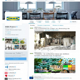
Page Twitter de IKEA France Twitter.com