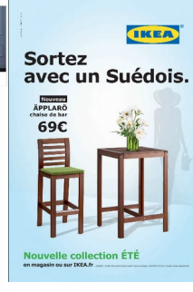
Affiche publicitaire