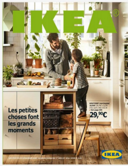
Couverture du catalogue Ikea.com

Objectif : mettre en évidence la stratégie de communication d'une entreprise transnationale.