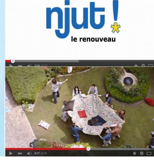
Spot publicitaire TV Youtube.com