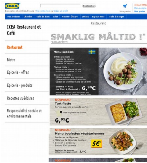
Page restaurant du site Ikea.com