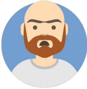
Rédacteur en chef