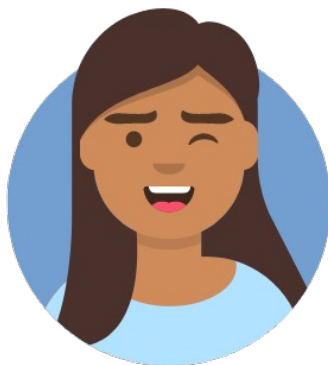
Rédactrice en chef