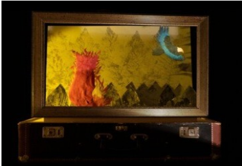
Le renard flamboyant