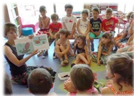
Explorer le monde : le bateau a chaviré...