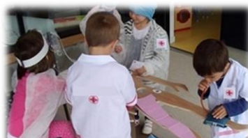
Jeu symbolique : soigner un malade

d'aménagement du temps de présence à l'école maternelle, les après-midis (Cf. Lettre Maternelle n°14 ).