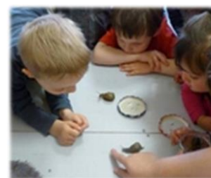
Les enfants observent des escargots

C pour mettre en évidence les avantages et les conséquences positives pour chaque partie.