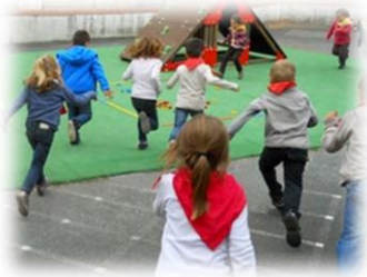
Jeu collectif dans la cour

personnes responsables doivent, sans délai, faire connaître au directeur ou à la directrice de l'école les motifs de cette absence (Article L.131-8 du code de l'éducation) selon les modalités définies dans le règlement de l'école.