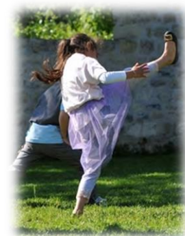
Activité dansée en extérieur