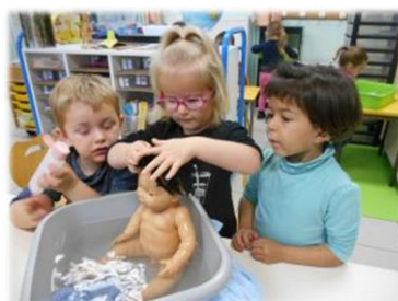
Le bain de la poupée

Les personnels sociaux et médicaux de l'école et/ou du quartier seront sollicités pour aider à comprendre certaines situations personnelles difficiles qui mettent les parents en grande insécurité, dans le respect du secret professionnel partagé .