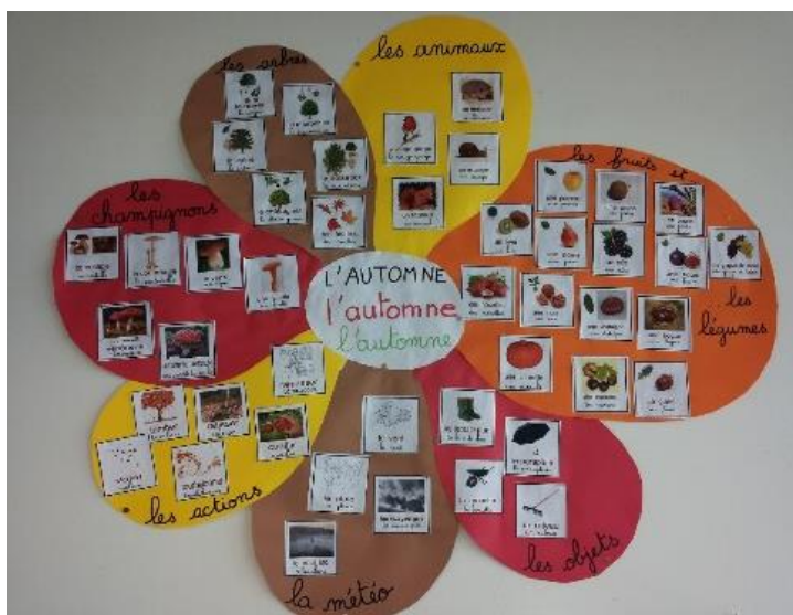
La fleur de langage