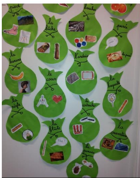
Sacs à mots