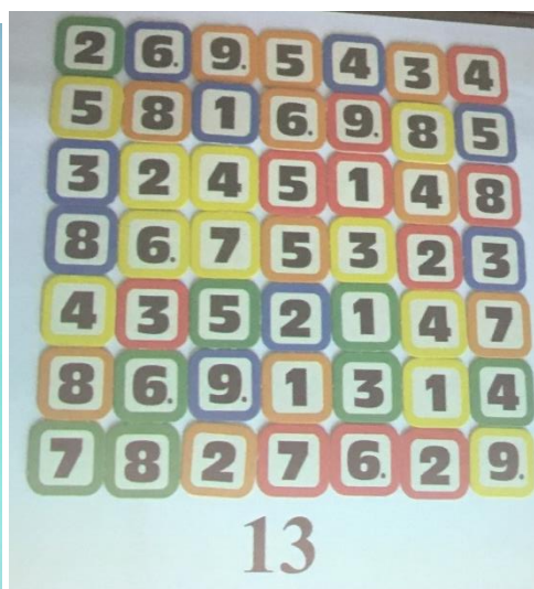
Cycle 2 DUO