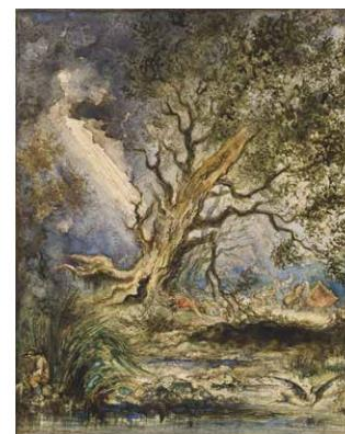
Gustave Moreau, Le Chêne et le Roseau , 1883, graphite, aquarelle, gouache, collection particulière

Vous trouverez, en suivant ce lien, un dossier de presse qui détaille des œuvres sur le site du musée : https://musee-moreau.fr/sites/moreau/files/documents/Dossier%20de%20presse_o.pdf